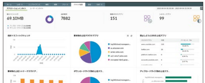
Log360 Cloud クラウド監査画面

CASB(Cloud Access Security Broker)機能を使用することで、組織で利用しているクラウドサービスの使用状況の監査や、禁止アプリへのアクセスブロックを実施できます。