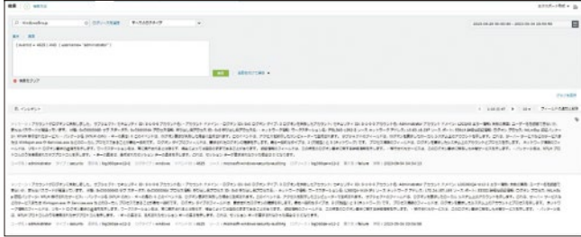
Log360 Cloud ログ検索画面

クエリ入力や期間で条件指定することで、収集したログを簡単に検索できます。イベントIDやユーザー名などの項目や値を指定して、ユーザーインターフェース上から直感的な操作でログ検索できます。