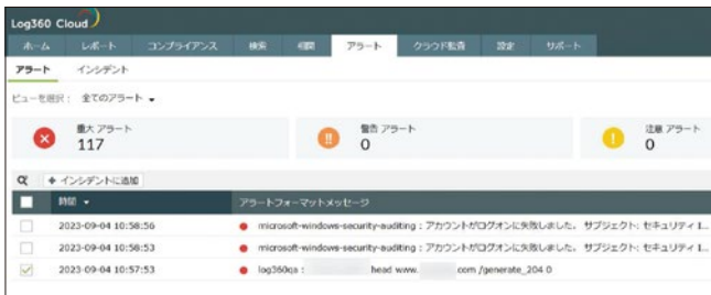
Log360 Cloud アラート画面

特定のログを収集した際にアラートを発報できます。ログに含まれるイベントIDやユーザー名、リモートIPアドレスといった条件を指定できます。アラート発生時にメールなどで管理者に通知します。