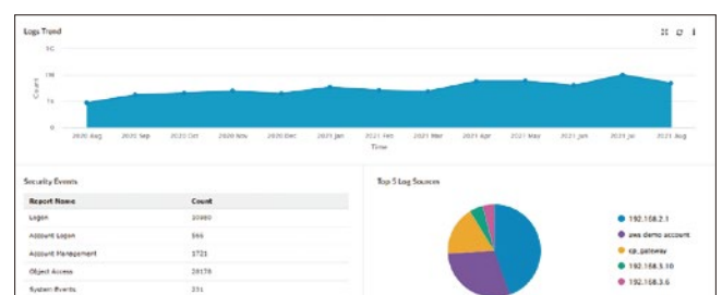
Log360 Cloud ダッシュボード画面

※ログの収集にはLog360 Cloudエージェントをインストールする必要があります(クラウドサービスのログを除く)。