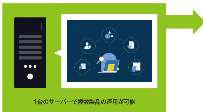
1台のサーバーで複数製品の運用が可能

製品を個別に導入する場合、製品ごとにサーバーを用意する必要がありました。しかしLog360では、複数製品の機能を1台のサーバーで管理することができ、サーバーコストを削減します。